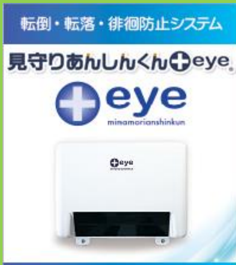
徘徊防止装置「見守りあんしんくん+eye

患者さんの頭を追従して、 ベットエリアから徘徊されるのをお知らせ。 ベッドエリアを自動認識(特許)で、設定 が簡単に行える。