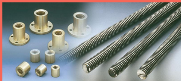
台形ネジ・ナット