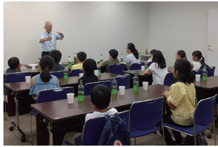
こども齋が開見学デー（出前授業）

全国の企業、NPO等の役割が大きく期待されています。若者たちの豊かな教育環境づくりに向け、当NPOもその一員として出前授業などの応援をしています。