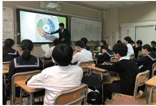
文京区公立中学校（会社と仕事について）