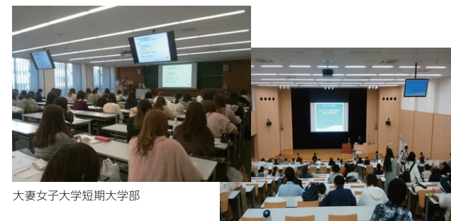
大妻女子大学短期大学部

また、大学・大学院向けには、企業経営や実務体験を語るリレー講座やワークショップなど、担当教授の教育プログラムのお手伝いをしています。