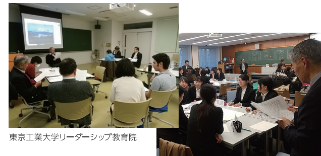
東京工業大学リーダーシップ教育院

大妻女子大学 短大ワークショップ 大学・高校への講師派遣 インターンシップ受け入れ及びインターンシップ先紹介