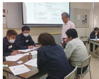
中堅社員ステップアップ研修

当NPOクラブの実務経験豊富な講師陣を派遣し豊富で多様な実務経験に根差した新人研修・中堅研修・幹部研修を行なっています。法人研修事業を行っている会社とのコラボでは、「ものづくり系」の講師派遣が喜ばれています。